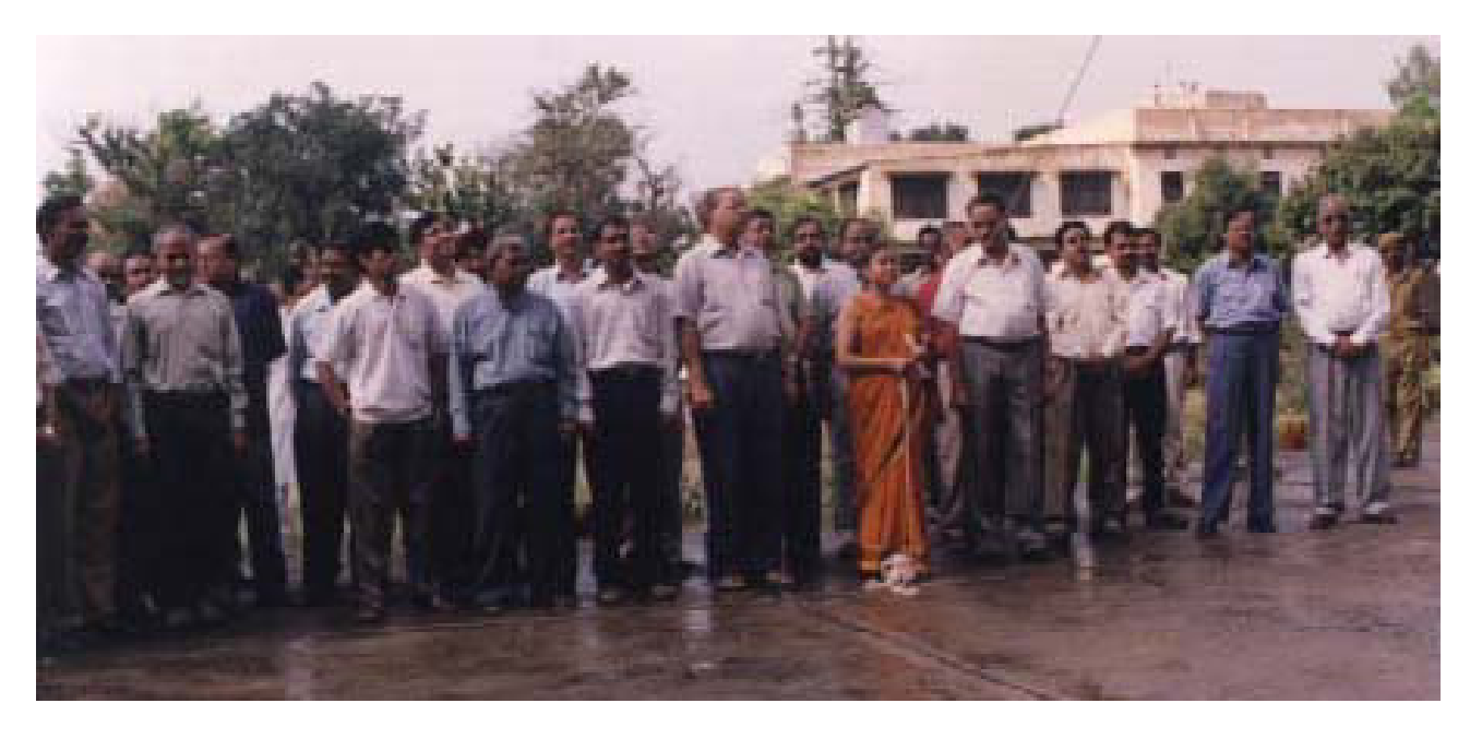
A view of Independance Day celebrations 2003

Evolution is no linear family tree, but change in the single multidimensional being that has grown to cover the entire surface of earth.